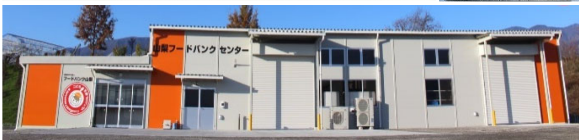
食糧支援活動の拠点、新山梨フードバンクセンター建設を、支援しています。